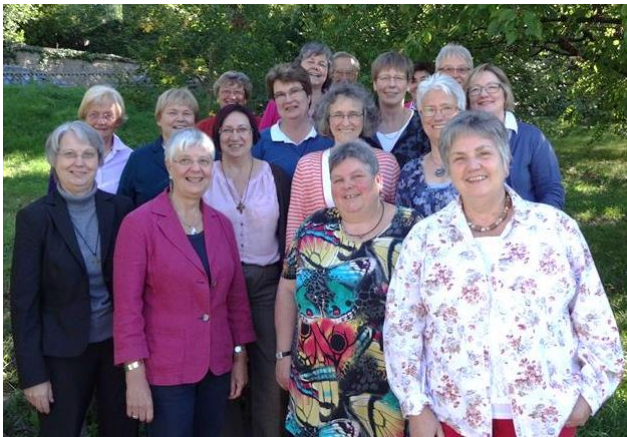
Die Teilnehmerinnen der Mitgliederversammlung am 25./26. September 2015 in Heppenheim

Der am 11. September 2015 verabschiedete Abschlussbericht des nach fünf Jahren zu Ende gegangenen überdiözesanen Gesprächsprojekts