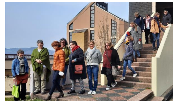
Frauen auf dem Weg „Diakonische Leitungsdienste für Frauen“ Klosterberg der Waldbreitbacher Franziskanerinnen