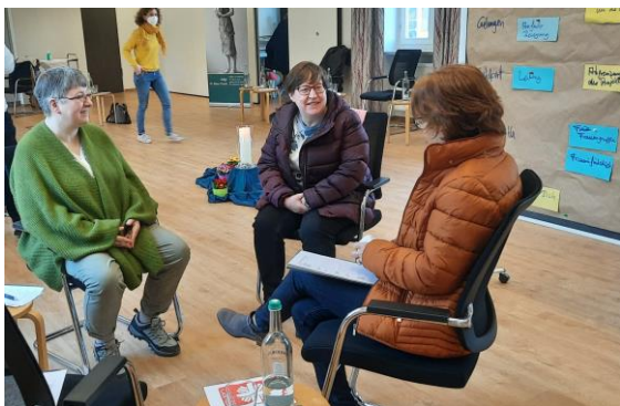
Bei der Gruppenarbeit